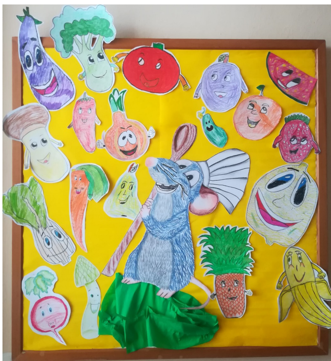
Obrázek 3: myšák Kuchtík

Jídelníček je sestavován tak, aby odpovídal zásadám správné výživy, aby uspokojil nároky dětského organismu, který roste a vyvíjí se. Snažíme se, aby byla strava vyvážená a zdravá, ale také aby dětem/žákům jídlo chutnalo. V jídelníčku máme dostatečně zastoupeny mléčné výrobky, luštěniny, ryby. Zařazujeme i cereální pečivo.