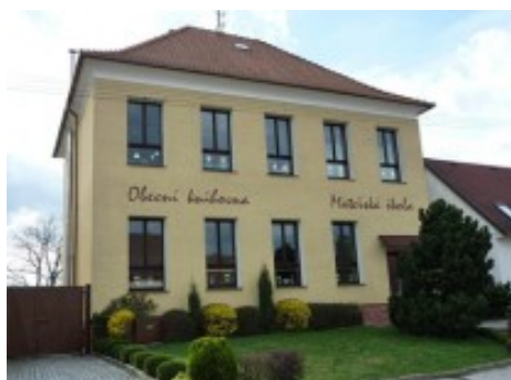
Obrázek 1: Naše MŠ